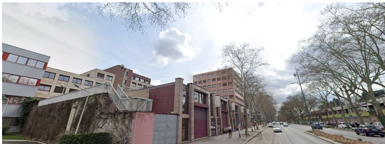
Vue 1 - (Mars 2023)