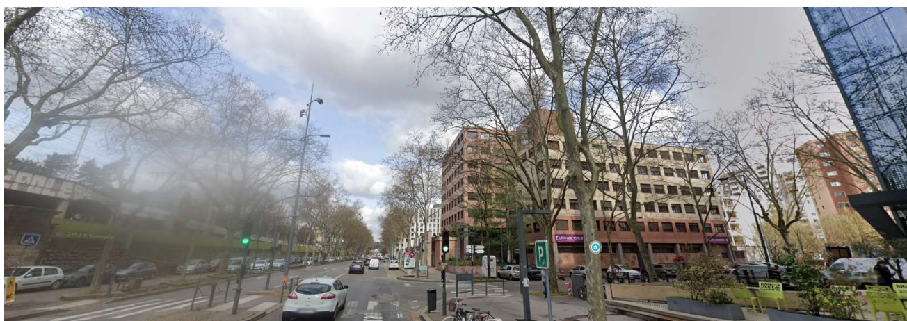
Vue 2 – Vue lointaine depuis le boulevard de Stalingrad (Mars 2023)