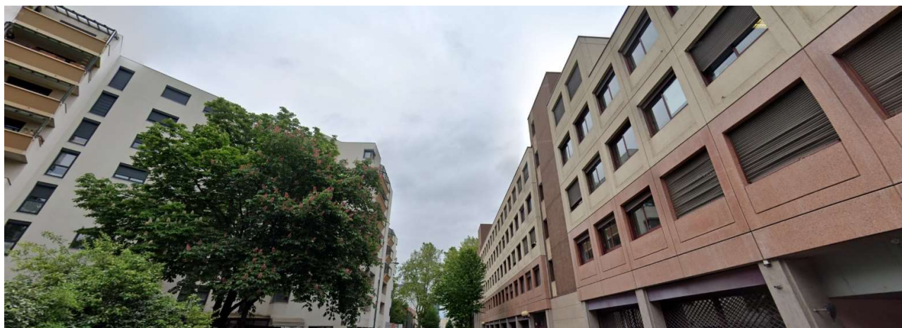
Vue 4 – Mai 2023