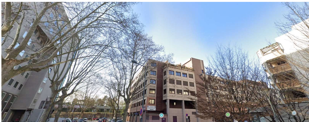
Vue 3 – (Mars 2023)